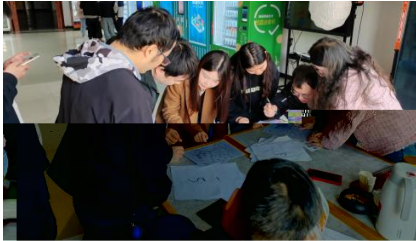
图 卓越团队建设共识营